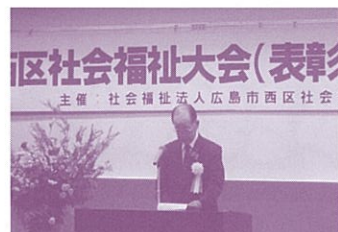
社会福祉大会(記念式典)

また、福祉まつりにおいては、雨天にもかかわらず約400名の来場者があり、盛大に開催することができました。福祉まつりの目玉として開催した抽選会では、豪華景品に期待をふくらませた多くの皆様の歓声で会場は、たいへん盛り上がりました。ご協賛いただきました企業の皆様に、感謝申し上げます。