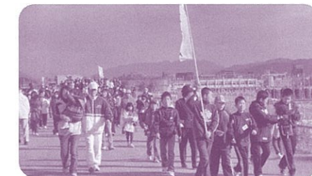
ウォーキング大会も多くの参加者で賑わいます。

本会は競技主体のものではなく、あくまで運動を通じて住民の健康づくりや、地域の連帯感を高めることを重視しています。体験機会の少ないトランポリン教室は子どもたちに人気があり、町内会ごとの活動にとどまっていたグラウンドゴルフも、現在は町内会対抗試合等で大いに盛り上がっています。ウォーキング大会も抽選会等の趣向を凝らし、毎年幅広い世代から多くの参加者があります。サマーフェスティバルは、各種スポーツ体験や観音高校サッカー部によるサッカー教室、南観音小学校プラスバンド演奏等、地域をあげての交流行事となっています。