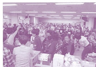
福祉まつり抽選会