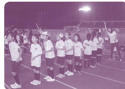
サマーフェスティバルでの大縄跳びの様子。毎年多くの参加者があります。

以前よりコココーラウエスト広島総合グラウンド等地元施設の活用と、地域住民の交流事業との連携を模索してきた中で、各団体の理解と協力のもと、平成22年7月28日に「南観フレッシュクラブ」設立に至りました。地域の人々が自由にスポーツを楽しみ、活動を通じて青少年の健全育成や地域活力の向上を図ることを目的としています。トランポリン、グラウンドゴルフ、ウォーキングを主種目とし、上記施設を拠点に現在114名の会員が毎月活動しています。他にも地域住民が幅広く参加できるサマーフェスティバルやウォーキング大会を開催しています。